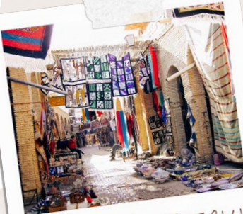
souks de Tozeur

14h30 : Départ pour les visites des gorges 16h30 : Visite des souks de Tozeur 17h30 : Soirée, repas et nuit à l' Hôtel Diar Habou Habibi****. Chalets en bois dans les arbres au milieu de la palmeraie / Piscine ou Hôtel Dar Horchani selon disponibilité