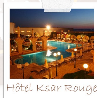
Hôtel Ksar Rouge