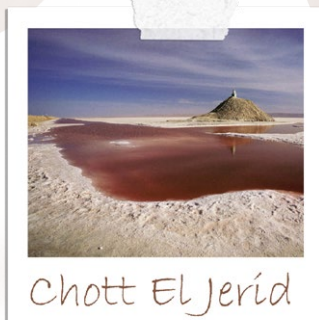
Chott El Jerid