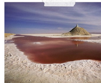
Chott El Jerid

08h00 : Petit déjeuner à l'hôtel Metaoui et traversée du Chott El Jerid en direction de Kebili visite des statues de sel Kebili, visite de Kebili l'ancienne. visite de Tamazret, cité Berbère